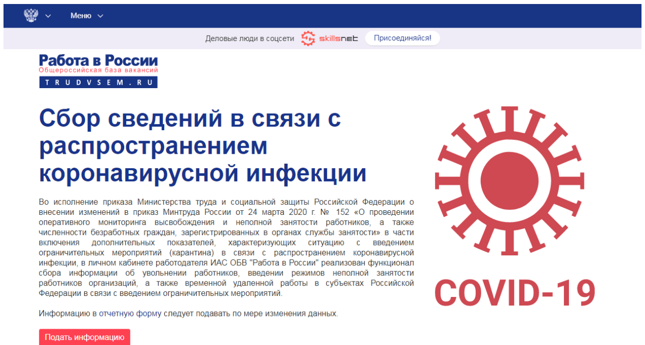
Рис. 2. Информационная страница